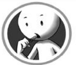
रुघा र खोकी

"नोवेल कोरोना भाइरस प्रभावित देशहरूबाट आउने मानिसहरूमा दुई हप्ता भित्र रुघाखोकी लागेमा, ज्वरो आएमा, घाँटी/टाउको दुखेमा, श्वासप्रश्वासमा अत्याधिक समस्या भएमा तुरन्त नजिकको स्वास्थ्य संस्थामा सम्पर्क गर्ने ।"