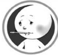
ज्वरो (१००.४°F भन्दा माथि)